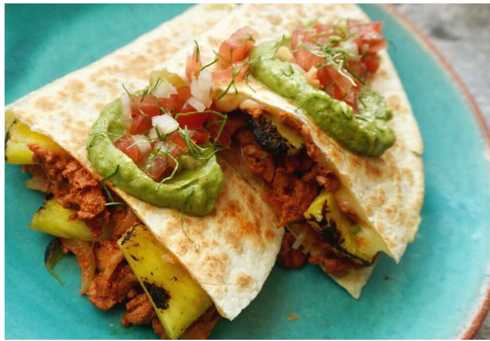
Grilld spicy pork Quesadilla スパイシーポークケサディージャ ¥1,200

フラワートルティージャに自家製スパイスミックスでマリネしたポークとパイナップル、たっぷりのチーズを挟んで香ばしく焼き上げた、メキシコ版包み 피자!