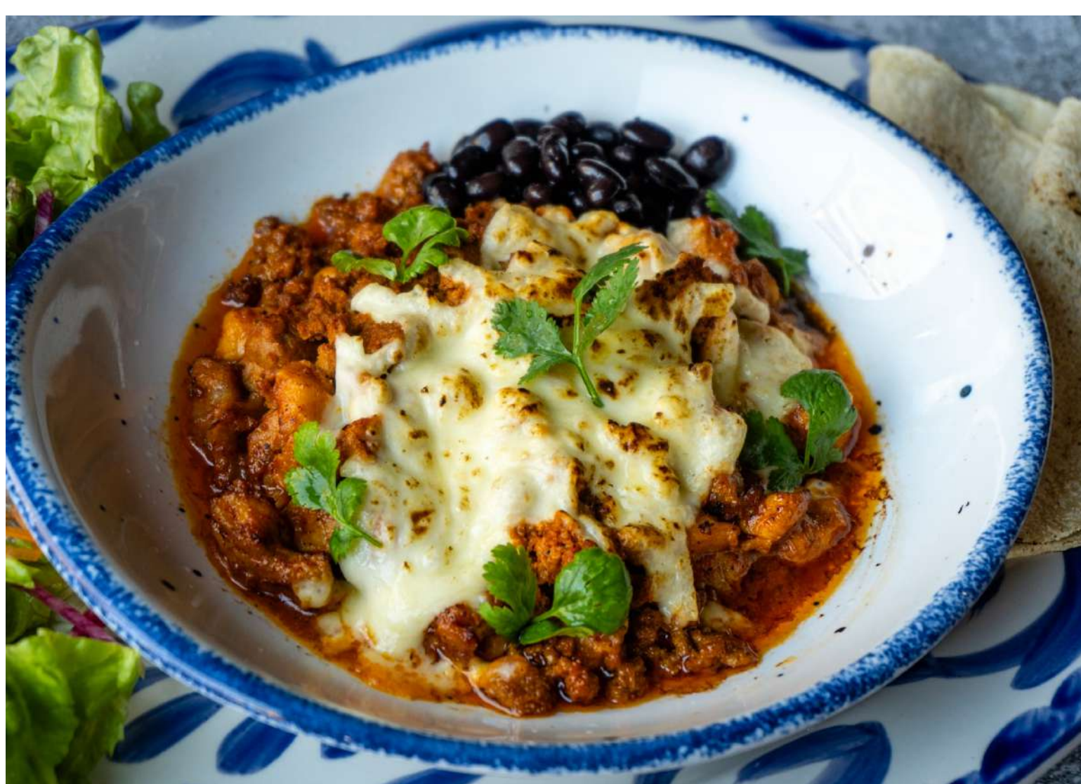
Choripollo チキンと Chorizo のチーズ焼き ¥1,200

Grill チキンに自家製 Chorizo とチーズをかけてオープンでこんがり焼きあげました。フラワートルティーヤに巻いてお楽しみください!