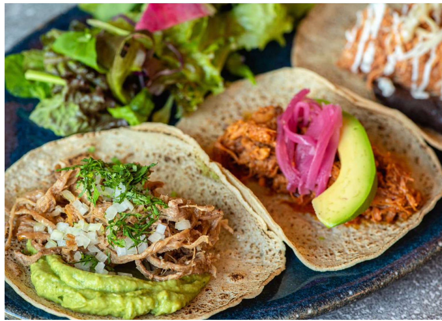
Today's 3 types of Tacos 本日の3種タコスセット ¥1,200

フラワートルティージャに自家製スパイスミックスでマリネしたポークとパイナップル、たっぷりのチーズを挟んで香ばしく焼き上げた、メキシコ版包み 피자!