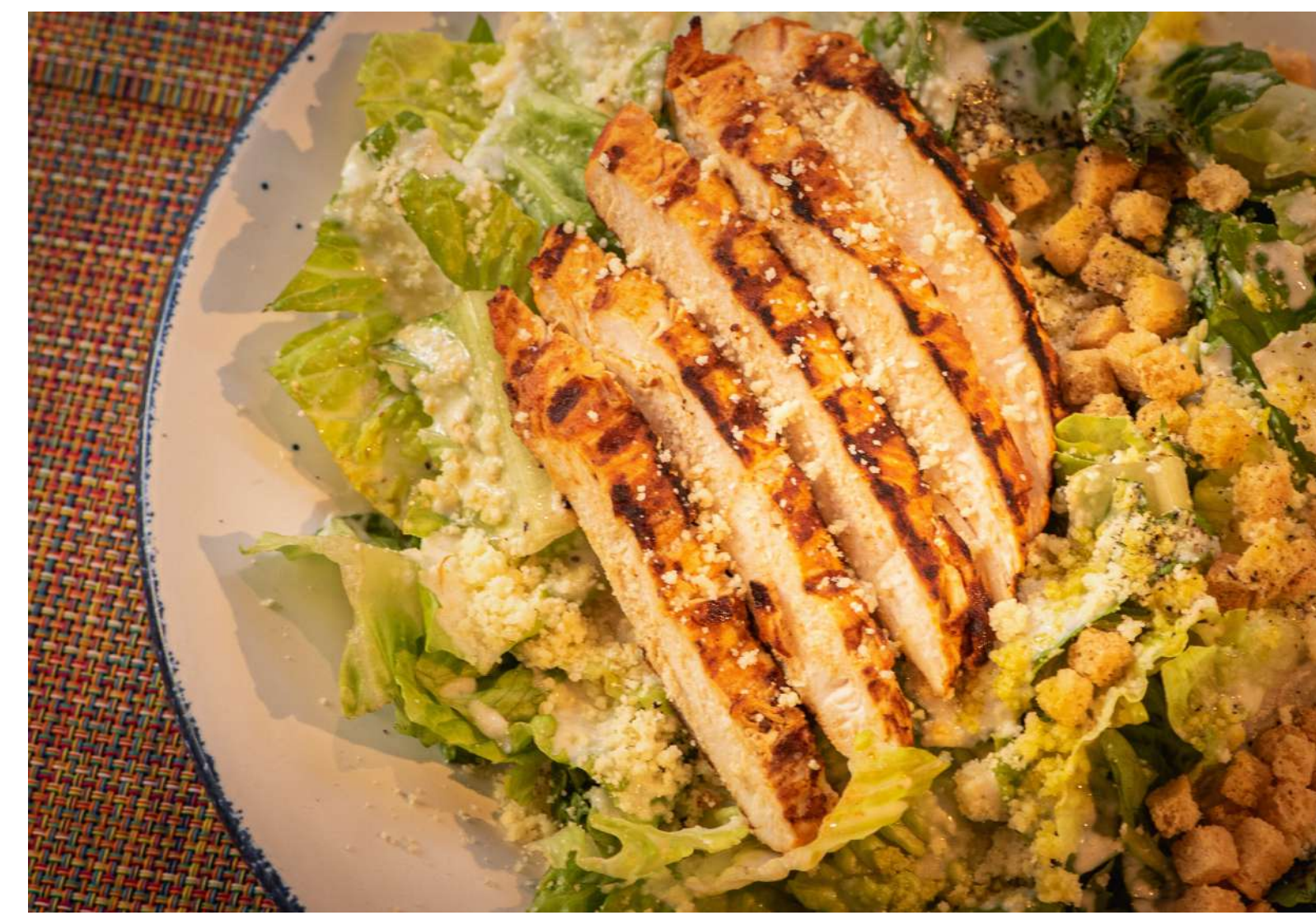
Chicken Cesar Salad 特製チキンシーザーサラダ ¥1,100

Grill チキンに自家製 Chorizo とチーズをかけてオープンでこんがり焼きあげました。フラワートルティーヤに巻いてお楽しみください!