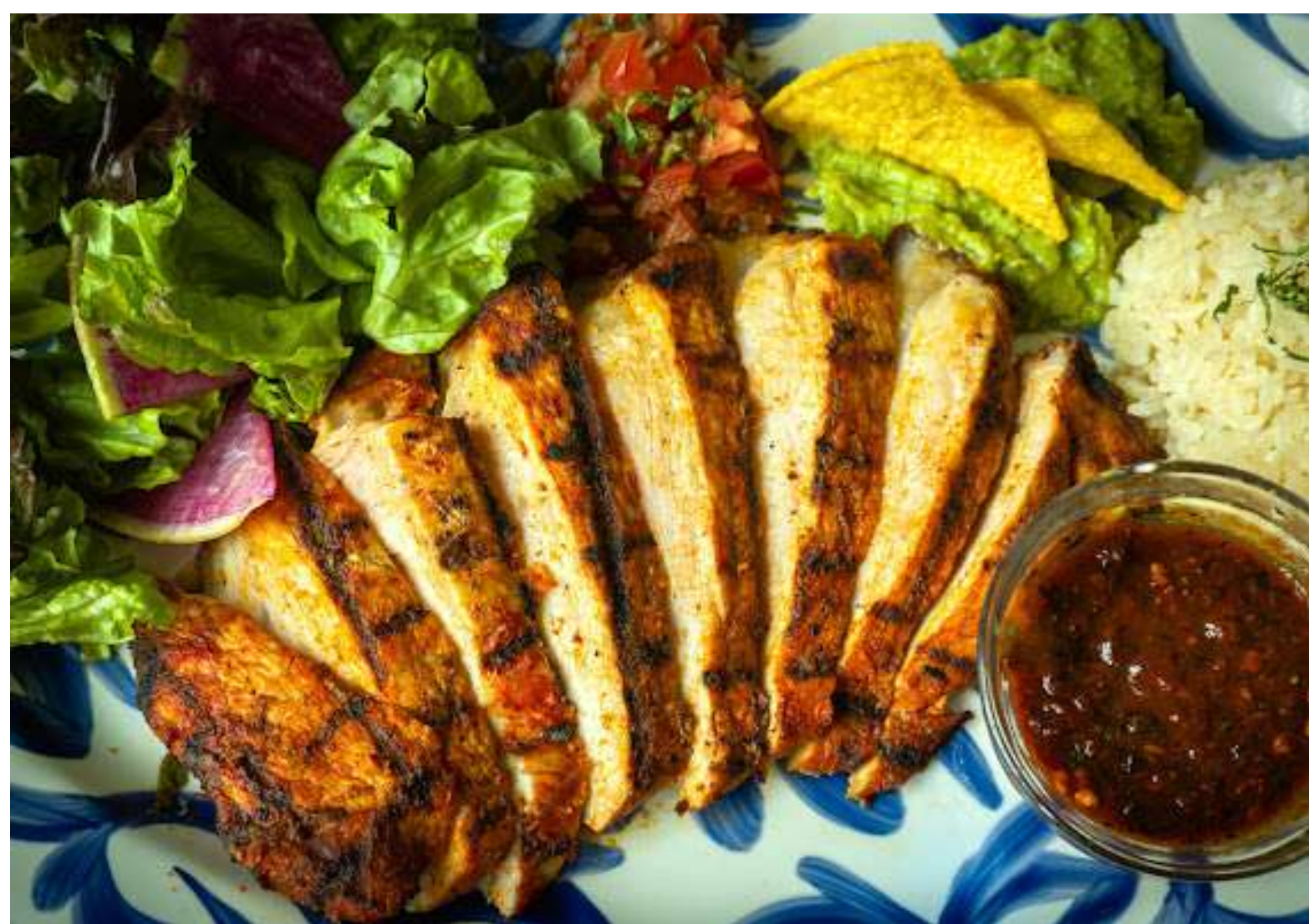
Mexican marinade grilled pork メキシカン Grill ポーク ¥1,300

柔らかいロース肉を唐辛子やスパイスでマリネし Grill で香ばしく焼き上げた、トゥデイズで人気の品がメニューに仲間入り!