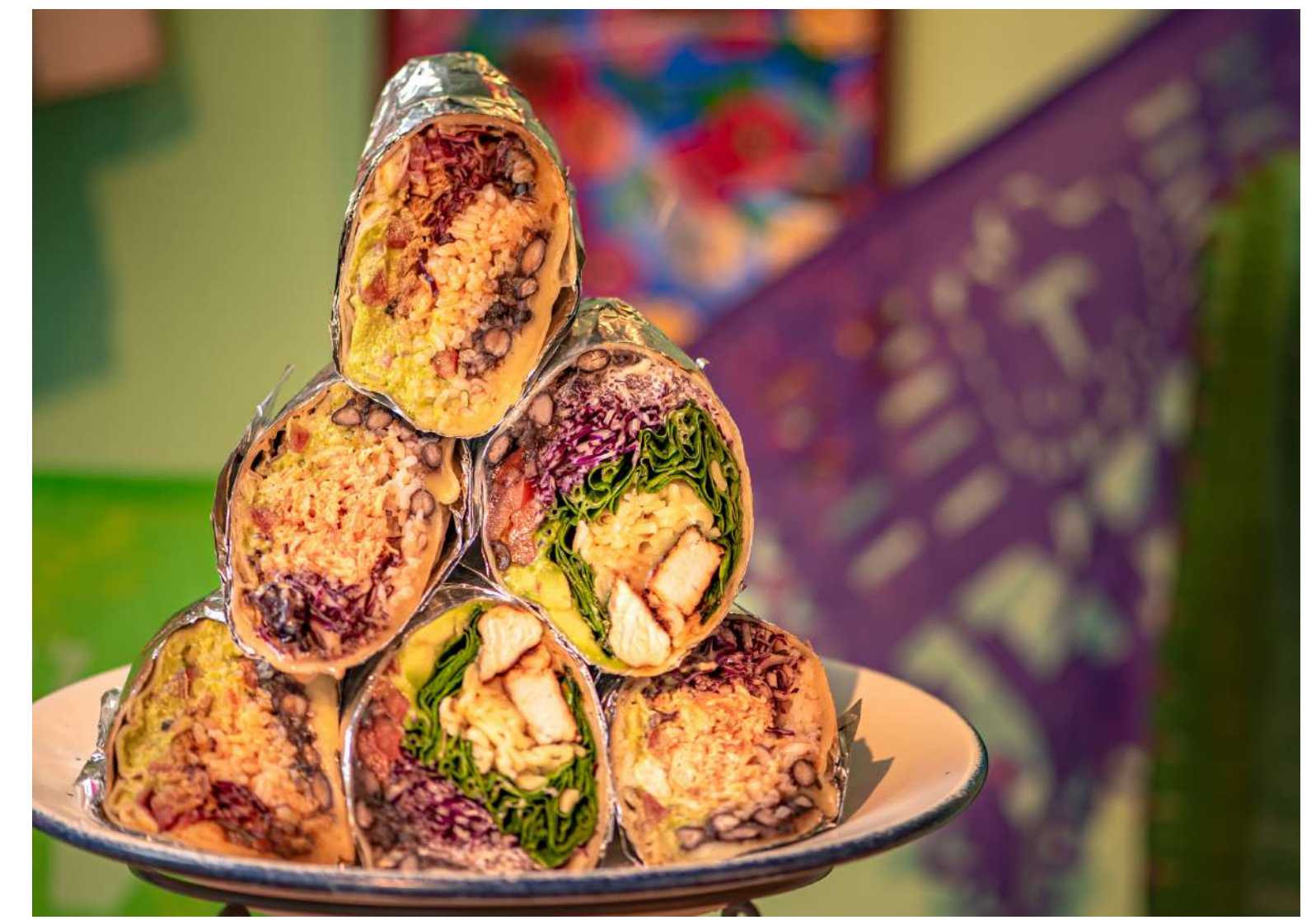
Today's Burrito 本日のプリトー ¥ASK

その日のおすすめタコス3種類をご用意! 自家製コーントルティージャを使用した、こだわり本格派メキシカンタコスです。