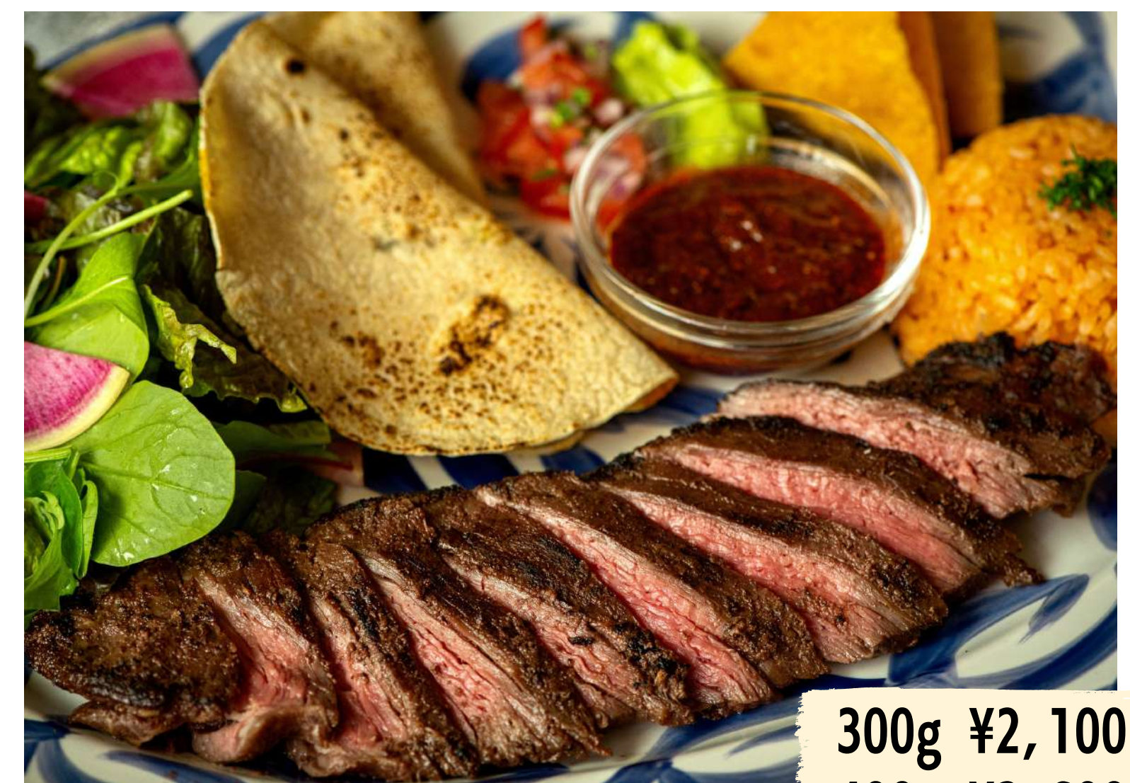
Mexican Beef Steak メキシカンビーフステーキ 200g ¥1,600

人気のフェアがメニューに! メキシコ産ハラミを特製マリネに漬け、Grill でジューシーに焼き上げました。お好きなグラムをお選びください。