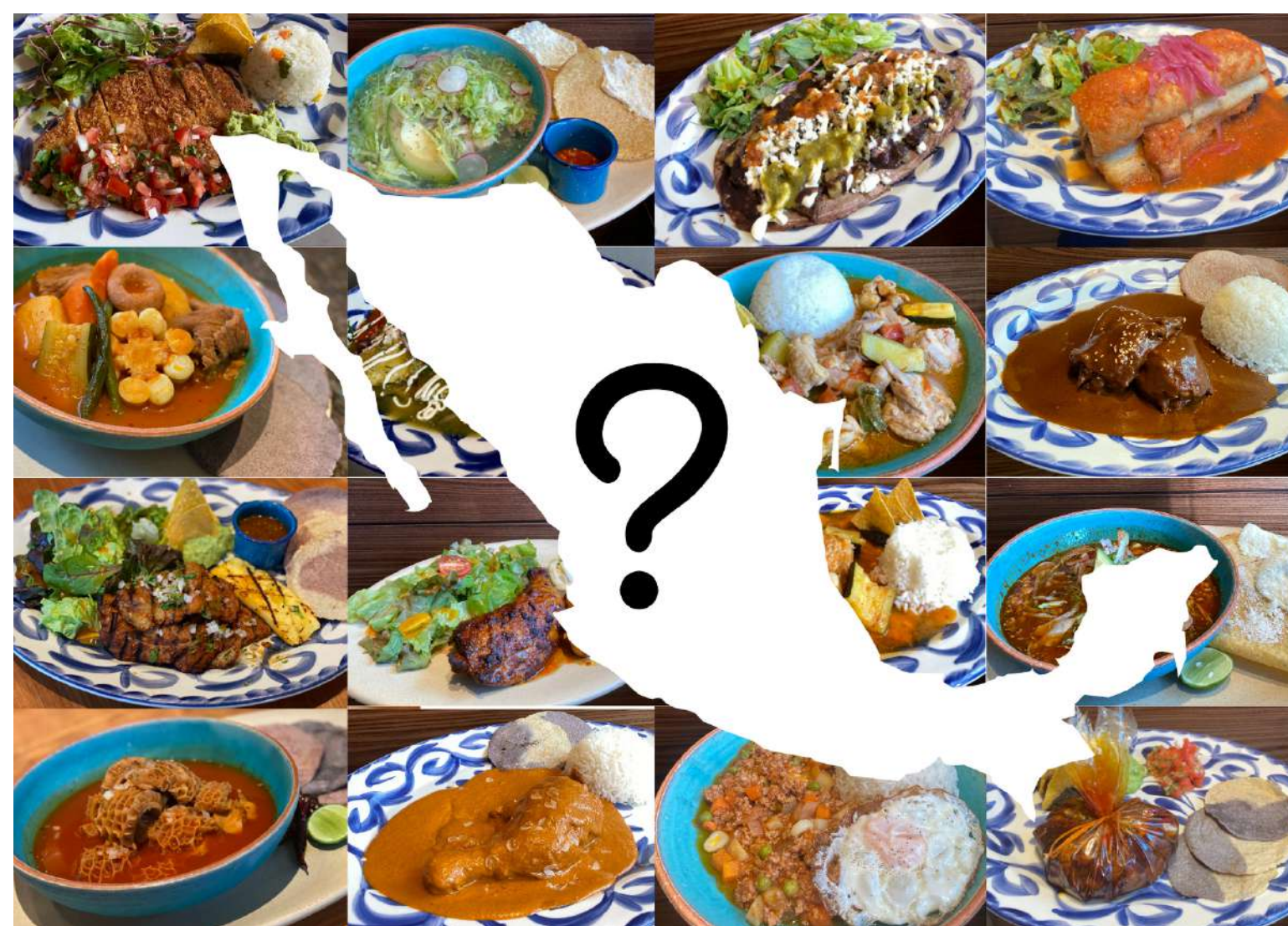
Today's Mexican plate スージーの 日替わりメキシカンプレート ¥1,300

柔らかいロース肉を唐辛子やスパイスでマリネし Grill で香ばしく焼き上げた、トゥデイズで人気の品がメニューに仲間入り!